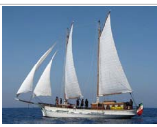
La goletta Oloferne su cui si svolgeranno alcuni degli incontri letterari

È la prima edizione della rassegna di letteratura e cultura marinai, ed è attesa a Lerici (La Spezia) dal 18 al 20 settembre. "Lerici legge il mare" al suo esordio è dedicata a pirati, corsari e lupi di mare, figure emblematiche nell'immaginario marinai, che saranno al centro degli incontri che si terranno in piazza Garibaldi e in piazza Mottino, al Castello di San Giorgio, a Santerenzo, a Tellaro e su due imbarcazioni d'epoca, la goletta