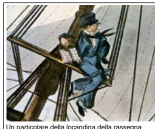
Un particolare della locandina della rassegna